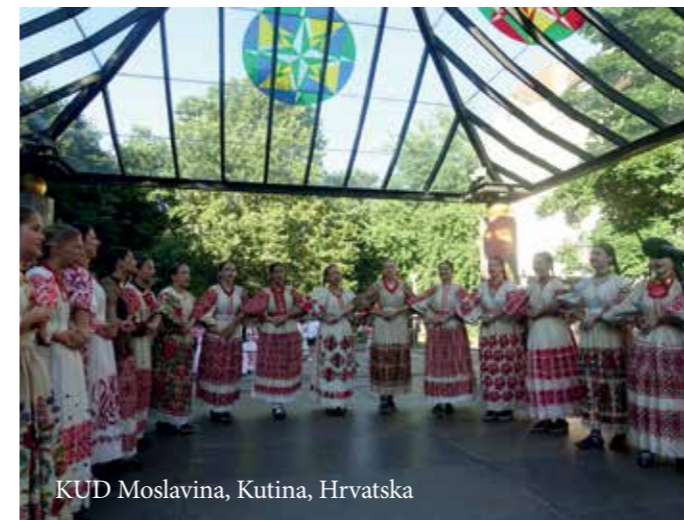
KUD Moslavina, Kutina, Hrvatska