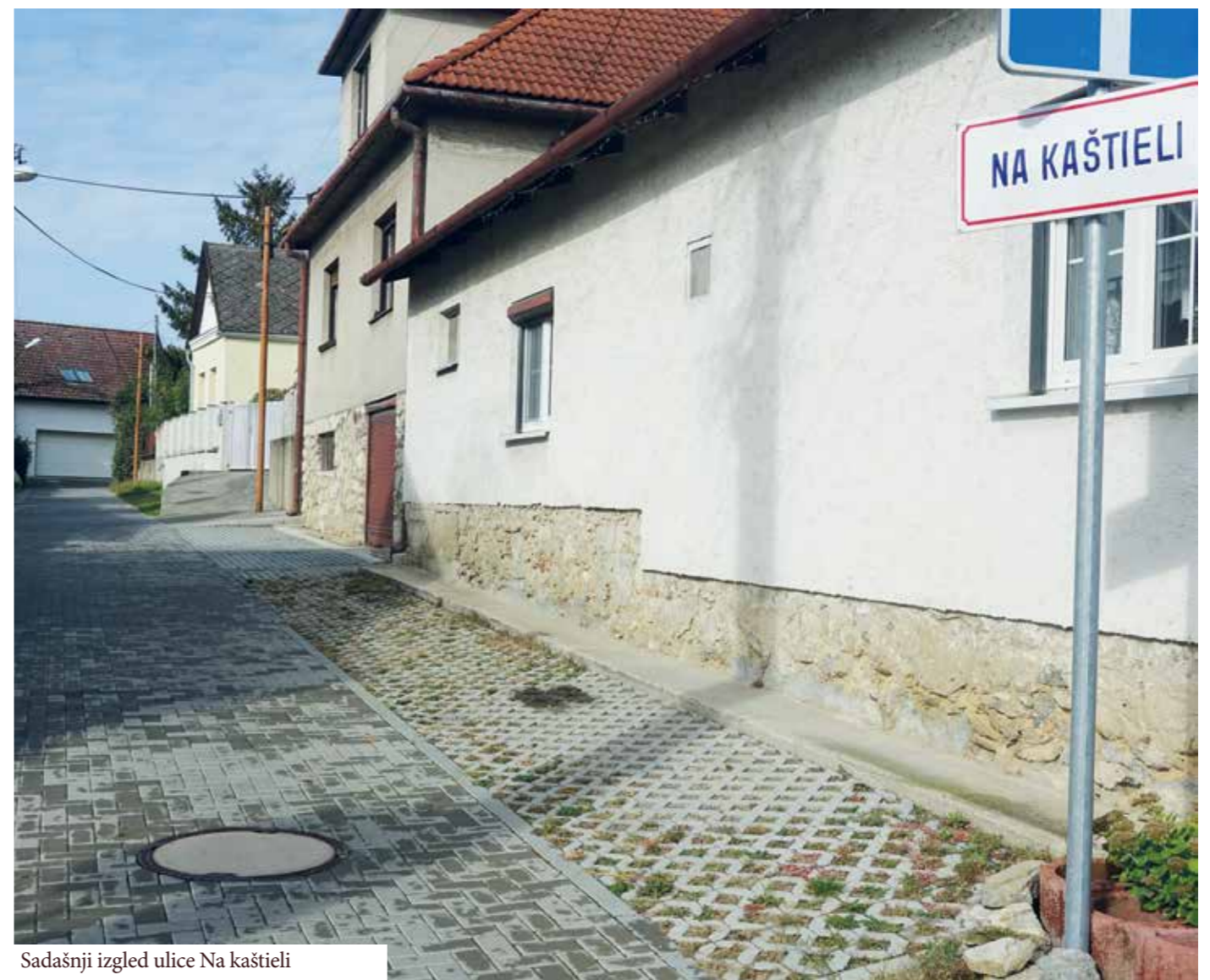
Sadašnji izgled ulice Na kaštieli