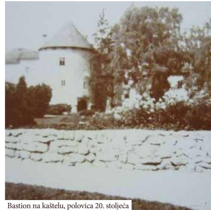
Bastion na kaštelu, polovica 20. stoljeća