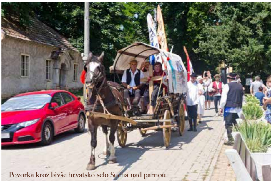
Povorka kroz bivše hrvatsko selo Suchá nad Parnou

Nedilju 16.7.2023 je njihovo putovanje i karavana završila u selu Suha nad Parnom (Suchá nad Parnou). U Suhoj nad Parnom su dopodne oblikovali skupa s folklornom skupinom „Chorvatanka“ iz Hrvatskoga Groba hrvatsku sv. mašu. Skupno su poslje toga zajedno bili i u povorki kroz ovo prije hrvatsko selo. Cijela priredba