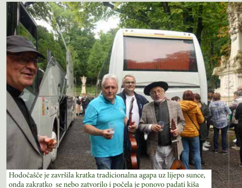
Hodočašće je završila kratka tradicionalna agapa uz lijepo sunce, onda zakratko se nebo zatvorilo i počela je ponovo padati kiša