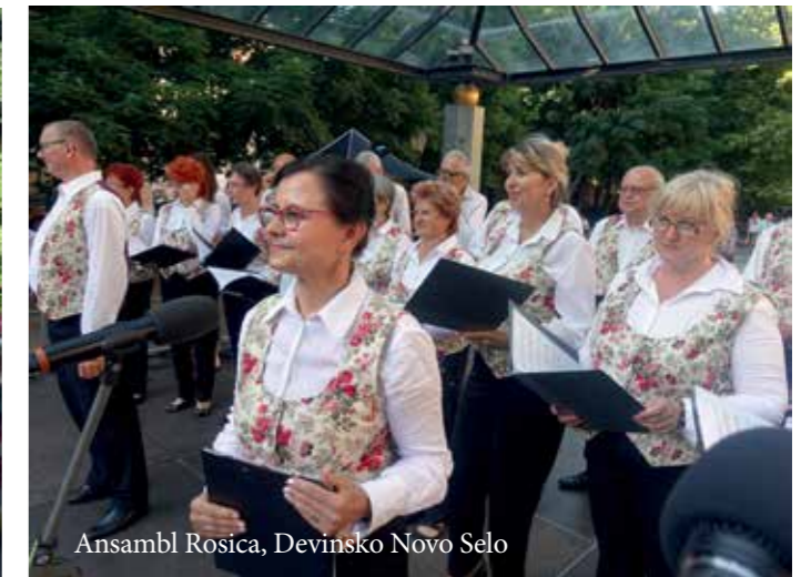
Ansambl Rosica, Devinsko Novo Selo