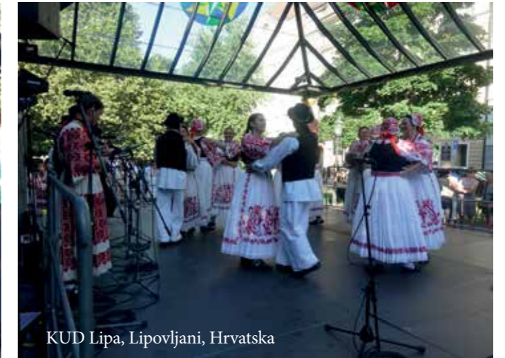
KUD Lipa, Lipovljani, Hrvatska