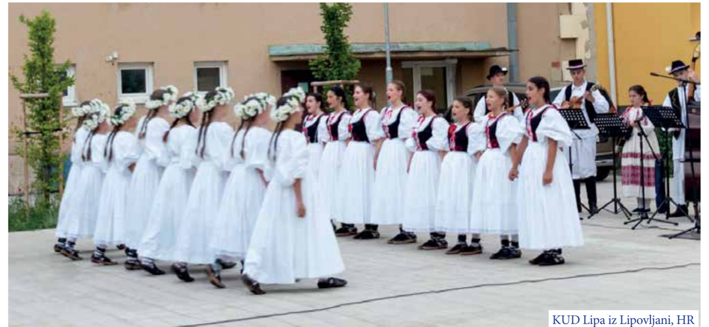
KUD Lipa iz Lipovljani, HR