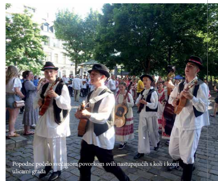
Popodne počelo svečanom povorkom svih nastupajućih s kolicima i konjima ulicama grada

Jedna od jur tradicionalnih priredaba, i to Festival Dobrodošli u Požunu/Bratislavi je i u ovom ljetu 2023. bio jedan od vrhunecov za hrvatski folklor i kulturu u Slovačkoj. Subotu 15. srpnja je isto kao deset ljet prije bio centar grada Bratislave i Trg P. O. Hviezdoslava pun hrvatskoga jezika, hrvatskih jačak i pjesmov i Hrvatic ter Hrvatov u narodnoj nošnji. 11. Festival Dobrodošli, koji se tradicionalno održava pod pokroviteljstvom Veleposlanstva Republike Hrvatske u Bratislavi je bio i malo veći i bogatiji nego u prošli ljeti. Glavni uzrok toga je bila činjenica, da u ovom ljetu svečujemo 490. obljetnicu dolazka gradišćanskih Hrvatov u srednju Europu, kada do danas njihovi potomci žive. U ljetu 1533. su potvrđeno došli prvi Hrvati i Hrvatice i u naše područje, i tako u glavnom zbog toga još danas živimo u ovi naši hrvatski seli u Slovačkoj, Austriji, Madjarskoj i Češ-