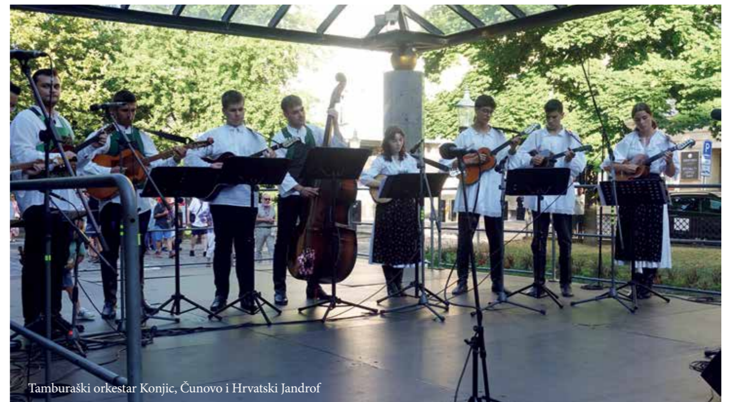
Tamburaški orkestar Konjic, Čunovo i Hrvatski Jandrof