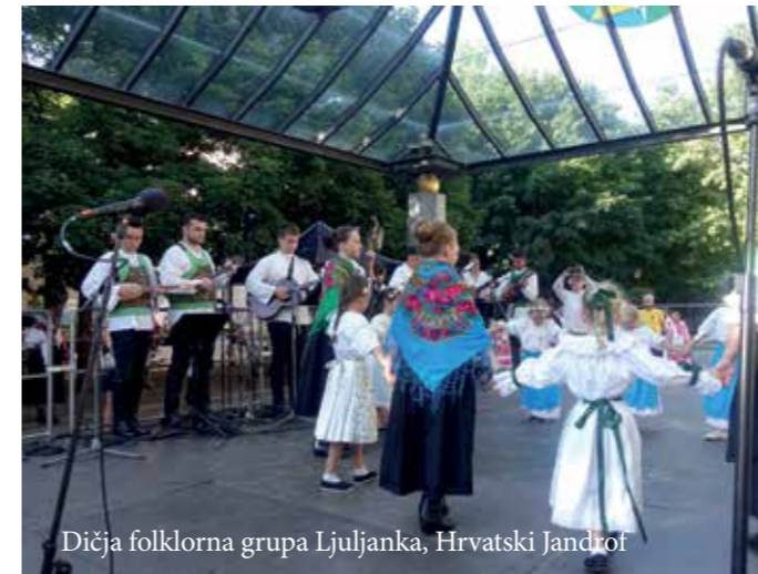
Diča folklorna grupa Ljuljanka, Hrvatski Jandrof