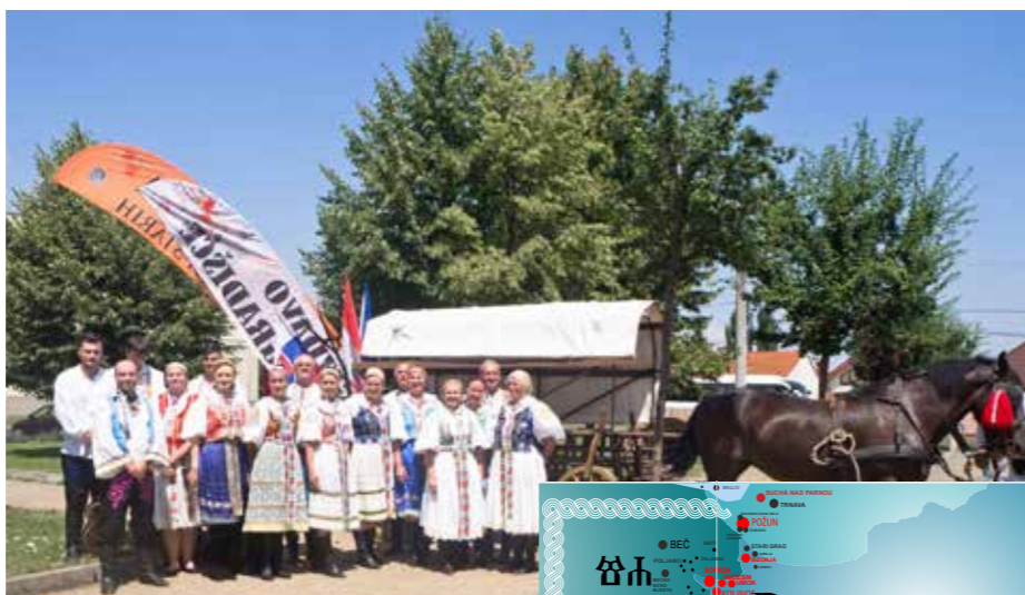
Folklorna skupina Chorvatanka iz Hrvatskoga Groba oblikovala je v seli sv. misu

se je bila završila s kulturnim programom, kade su bile nastupale ove dvi hrvatske folklorne grupe. Na zadnje triba zahvaliti i općini Suha nad Parnom/Suchá nad Parnou, prez ke pomoći nije bilo moguće ov prekogranični projekt u njihovom selu na ov lip način završiti. Vjerujemo da ćemo se svi zajedno u ovoj priredbi viditi opet za dvi ljeta i u Požonu/Bratislavi i seli Slovačkoj.