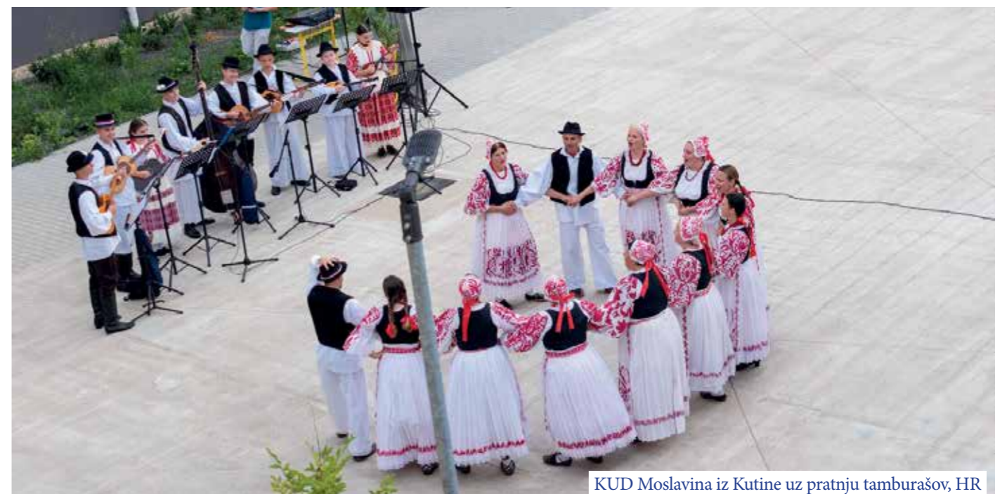
KUD Moslavina iz Kutine uz pratnju tamburašov, HR