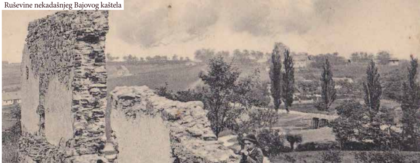
Ruševine nekadašnjeg Bajovog kaštela

Završilo je ovogodišnje iznimno vruće ljeto i mi se vraćamo našim redovnim Hrvatskim četvrtcima u Devinskom Novom Selu. U prvom polugodištu teme tih susreta bile su određene kronologijom, okruglom obljetnicom nastanka i za općinu, odnosno gradsku četvrt, značajnog događaja koji je promijenio ponajviše njezin intravilan. Čekaju nas teme o kojima do sada nismo razgovarali. Jedna od njih će biti