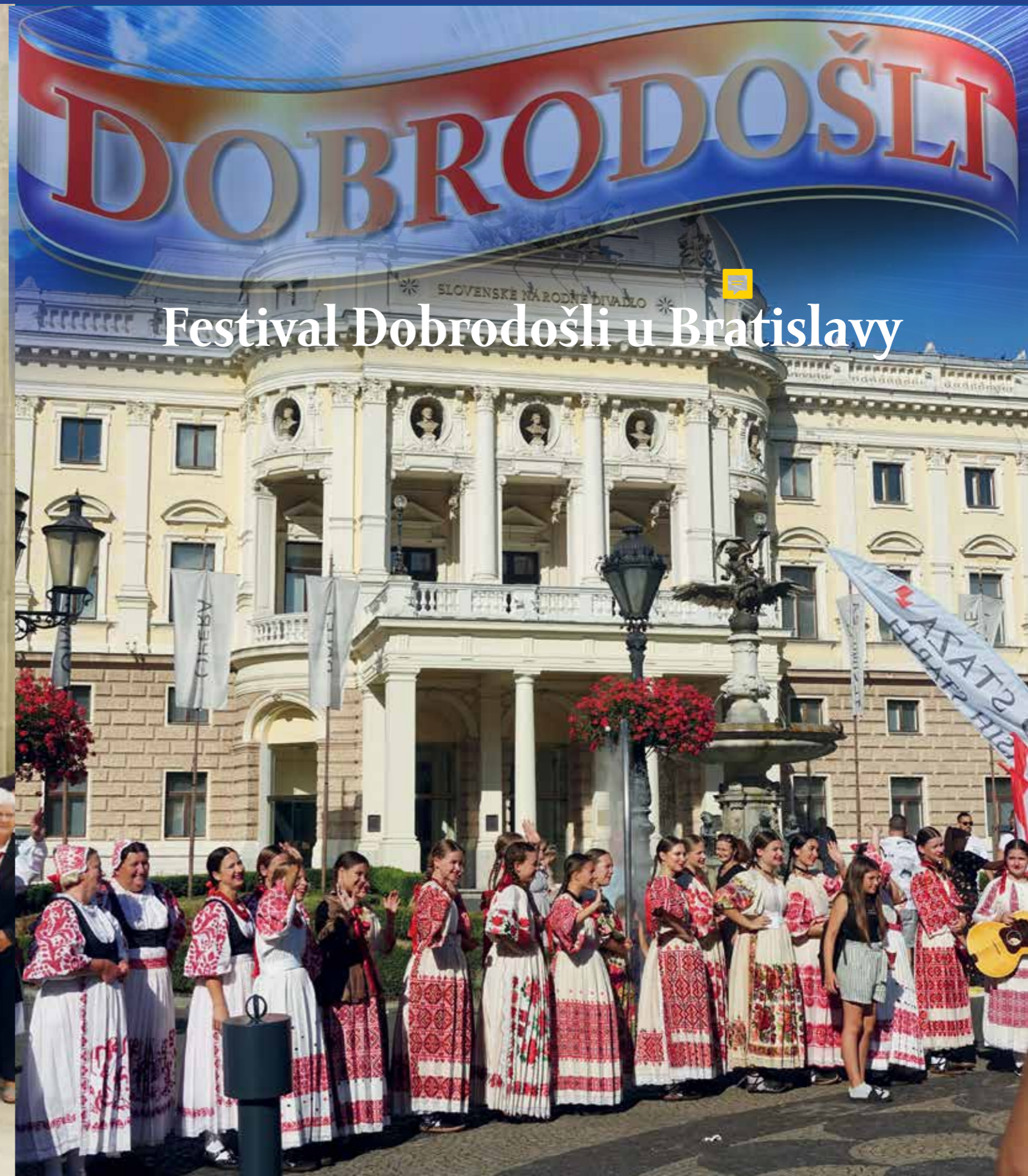
Festival Dobrodošli u Bratislavy