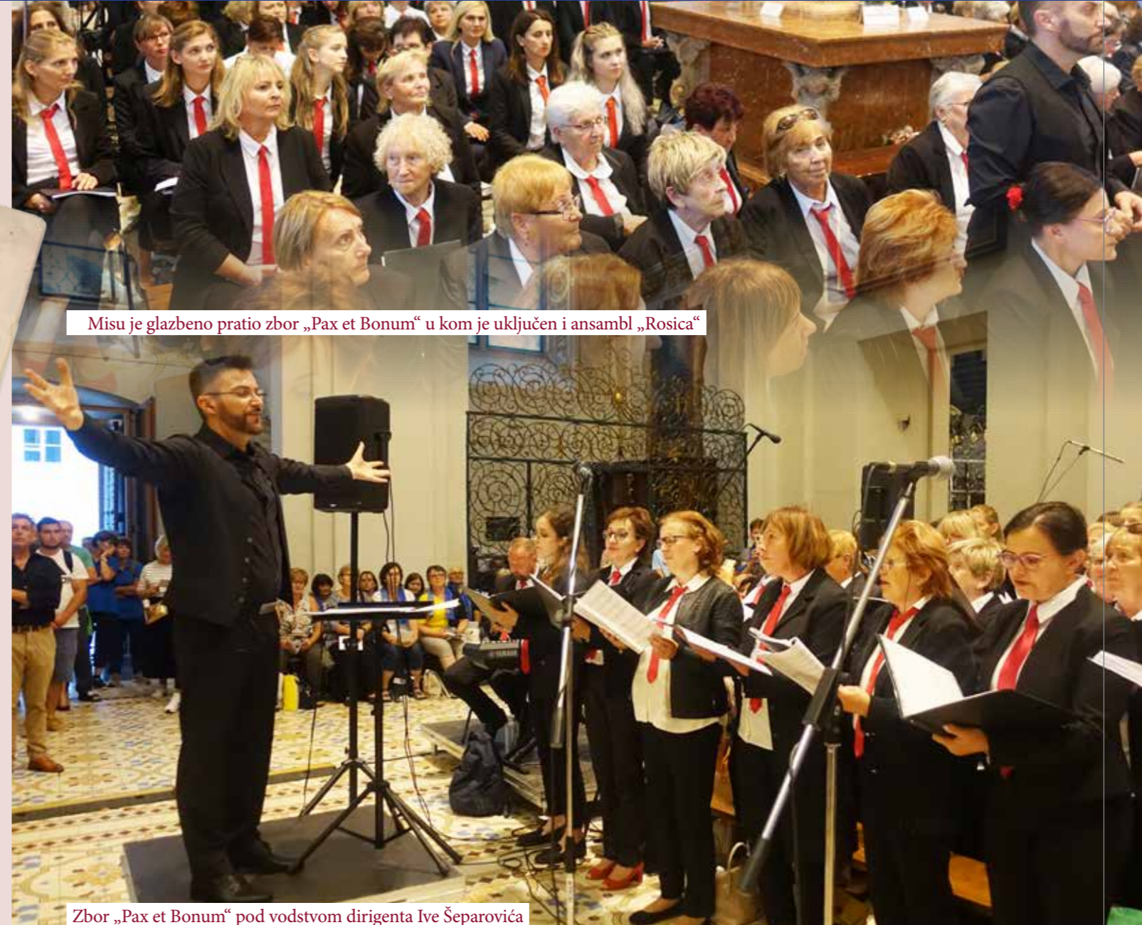
Misu je glazbeno pratio zbor „Pax et Bonum“ u kom je uključen i ansambl „Rosica“

Nažalost, često i neuspjeh u osobnom, crkvenom ili društvenom životu. Ali bez muke nema uskrsnuća! A koje su naše najveće muke? Nadbiskup Živković smatra da je to asimilacija i mržnja! I zato je Celjansko hodočašće zajedničko okupljanje Gradišćanskih Hrvata. Sada kada Gradišćanski Hrvati žive u Europskoj uniji u Slovačkoj, Austriji ili Mađarskoj, još su više povezani međusobno i s Hrvatima u svojoj staroj domovini. Samo zajedno mogu pomoći jedni drugima i sačuvati svoju vjeru.